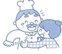
⑥ チョコパン ふたつ