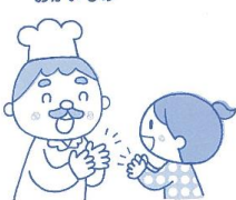
① パンパンパンやさんに おかいもの

ふたり細になり、ひとりがパン屋さん、もうひとりがお客さんになる。それぞれ、7回拍手をする。