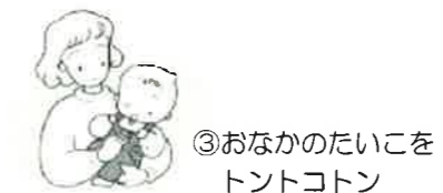
③おなかのたいこを トントコトン