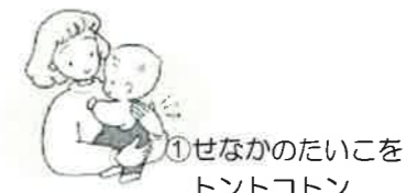
①せなかのたいこを トントコトン