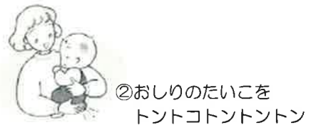
②おしりのたいこを トントコトントン