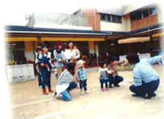
10月15日に交通安全指導がありました。 横断歩道の渡り方を教わりました!