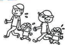
玉入れやサーキットをお母さんと一緒に楽しみました♪