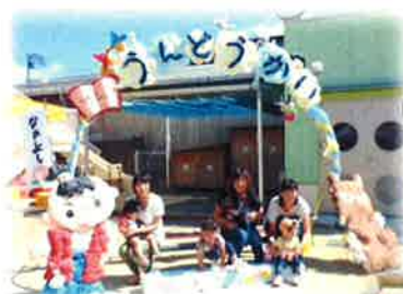
10月1日になかよしクラブの運動会がありました!

H25.11.1 なかよし保育園 子育て支援センター 事業推進委員会 Tel 086-253-0249 ホームページ http://www.kids-nakayoshi.jp/nakayoshi/