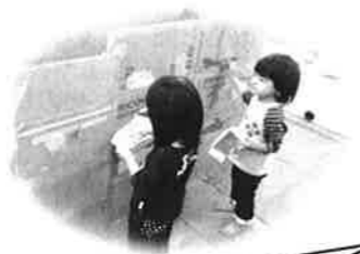
造形あそびをしたよ♪ 段ボールの家や、バスに 絵の具を使って可愛く色をつ けたよ！支援センターにある から遊びに来てね！