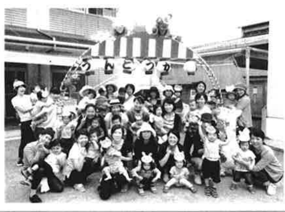
なかよしクラブ ミニ運動会 みんなで体操をしたり、ふれあい遊び をしたり、変身したり…たくさん体を動か して遊んだよ。

H26.11.1 なかよし保育園 子育て支援センター 事業推進委員会 Tel 086-255-4134 ホームページ http://www.kids-nakayoshi.jp/nakayoshi/