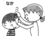
③あきはコオロギ くさのなか