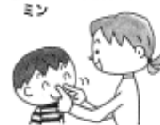
②なつはセミさん ミンミン