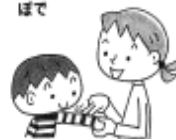
①はるはモグラも おさんぼで

♪歌いながらやさしく子どもの顔に触れて喜ばせましょう。子どもをひざの上にのせたり向かいあったりします。