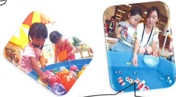
たくさん金魚がとれるかな?