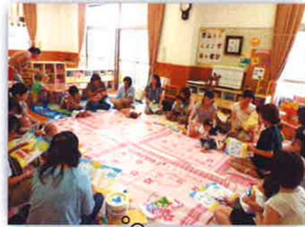
たくさんの赤ちゃんが参加してくれました♪ 次回は10月です♪お楽しみに!