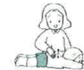
② トントンニンじん トントンネギ