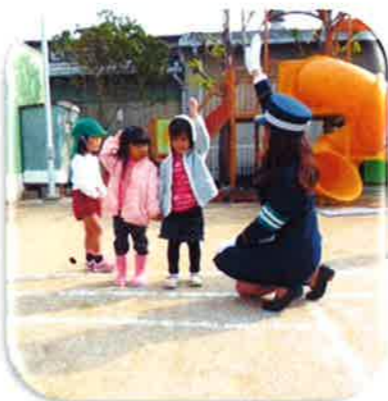
お母さんや、友達と一緒に横断歩道を上手に渡れたよ!