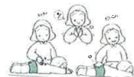
① トントンだいこん