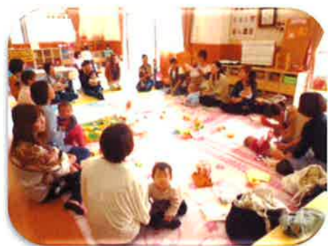
たくさんの親子が参加してくれました!