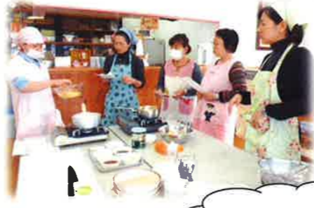
調理中の託児の様子♪