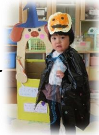
ハロウィンパーティー を楽しんだよ♪