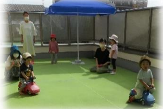
ミニミニ運動会をしたよ♪