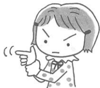
左手を右手にそえて、右手の人さし指と中指で鉄砲を撃つまねを4回する。