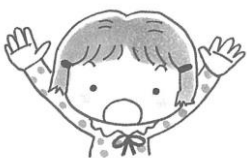
両手をあげてバンザイをする。