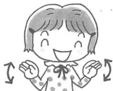
両手で手まねきを4回する。