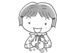
右手の人さし指と中指を立てウサギの耳の形を作り、左手でやさしくなでる。