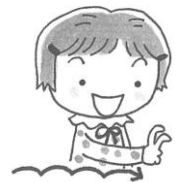
④の動作で右から左へ移動させる。