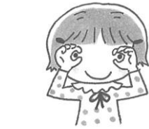
両手の親指と人さし指で輪を作り目 右手の人さし指と中指を立てる。